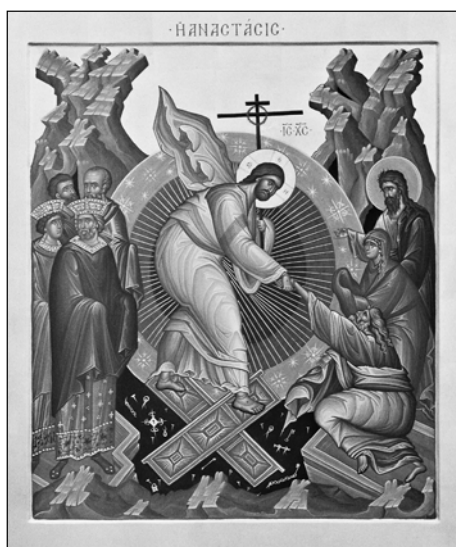
Воскресение Христова. Сийская иконописная мастерская.