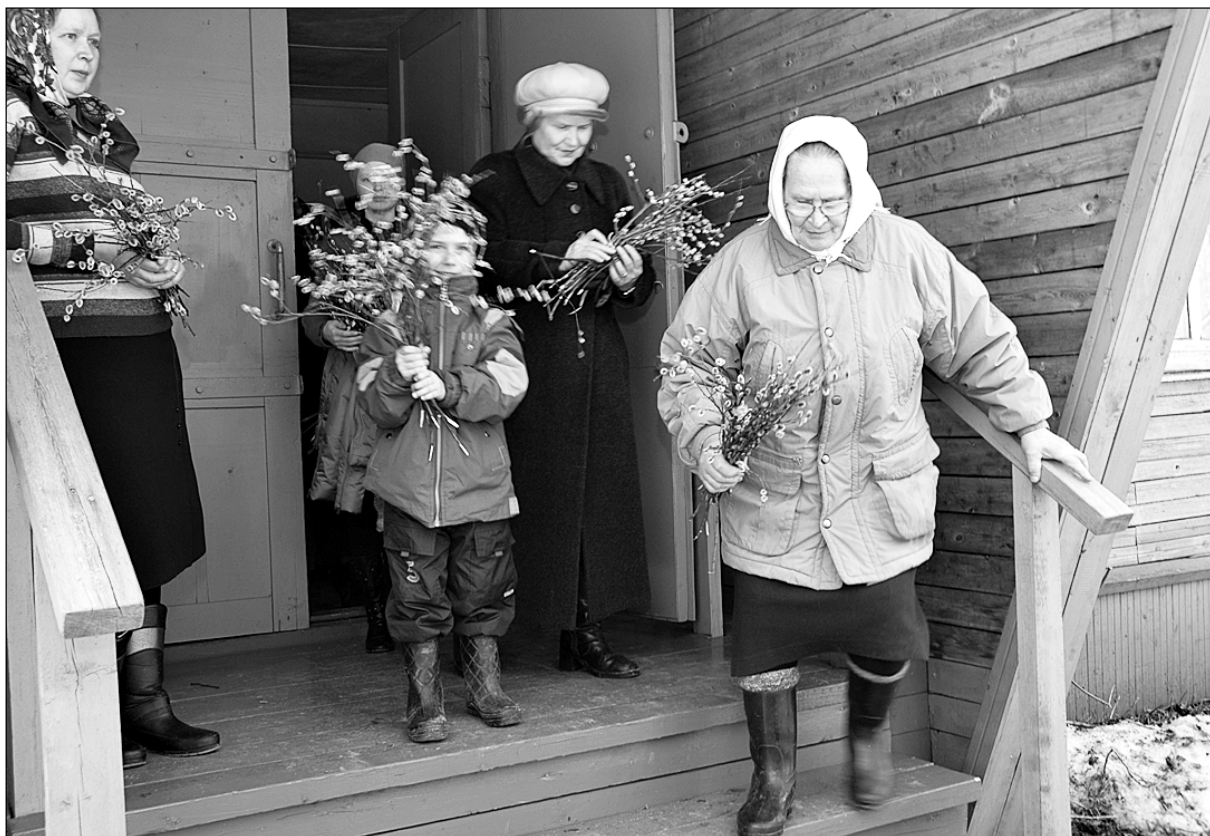
фото иконы Варлаама

Вербное воскресенье. Емецкое монастырское подворье. Храм преподобного Феодосия Сийского полон народа. И вот только что закончился праздничный молебен. Освящены вербочки. Умиротворенные прихожане покидают церковь и расходятся по своим домам, унося с собою радость праздника. В этот день богослужения совершены в храмах монастыря и на других подворьях обители.